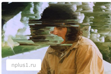
Безумие в наследство