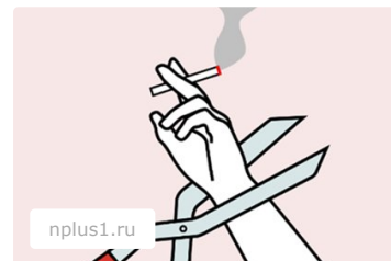
Ученые назвали лучший способ бросить курить